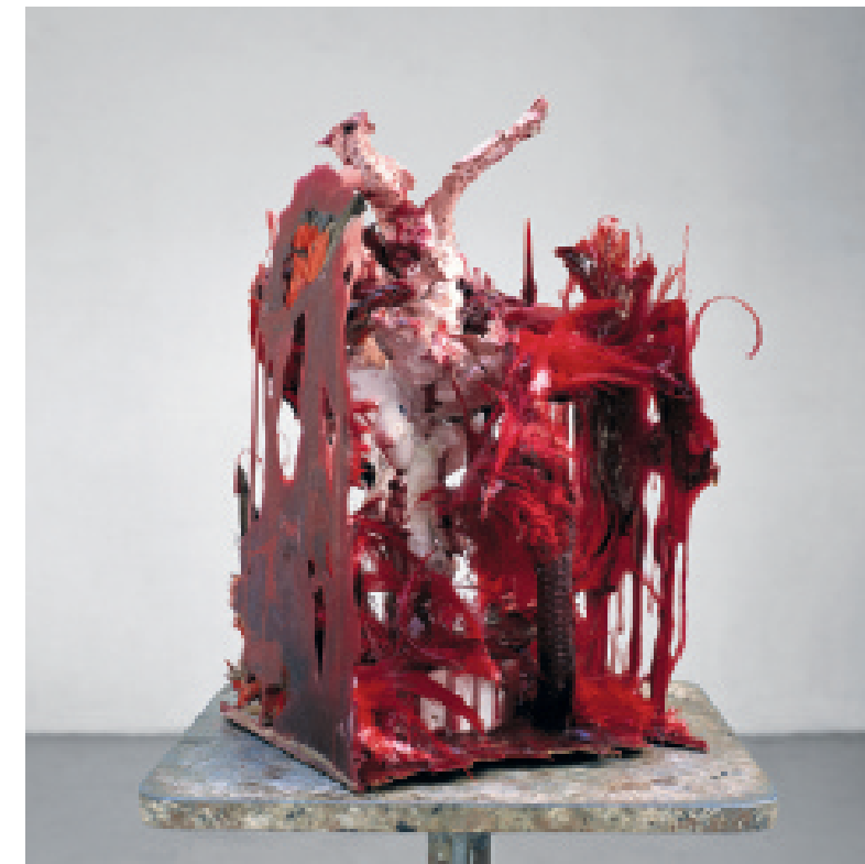
Heringa/Van Kalsbeek Zonder titel, 2002 35 x 26 x 20 cm

MEER ZIEN? HERINGA/VAN KALSBEK NACHTVANGST 13 SEPTEMBER 2014 T/M 11 JANUARI 2015 Stedelijk Museum 's-Hertogenbosch WWW.SM-S.NL