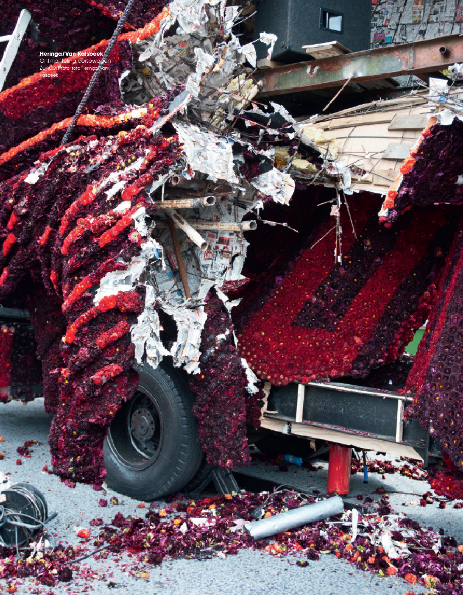
Heringa/Van Kalsbeek Ontmanteling corsowagen Zonder foto: foto Heringa/Van Kalsbeek