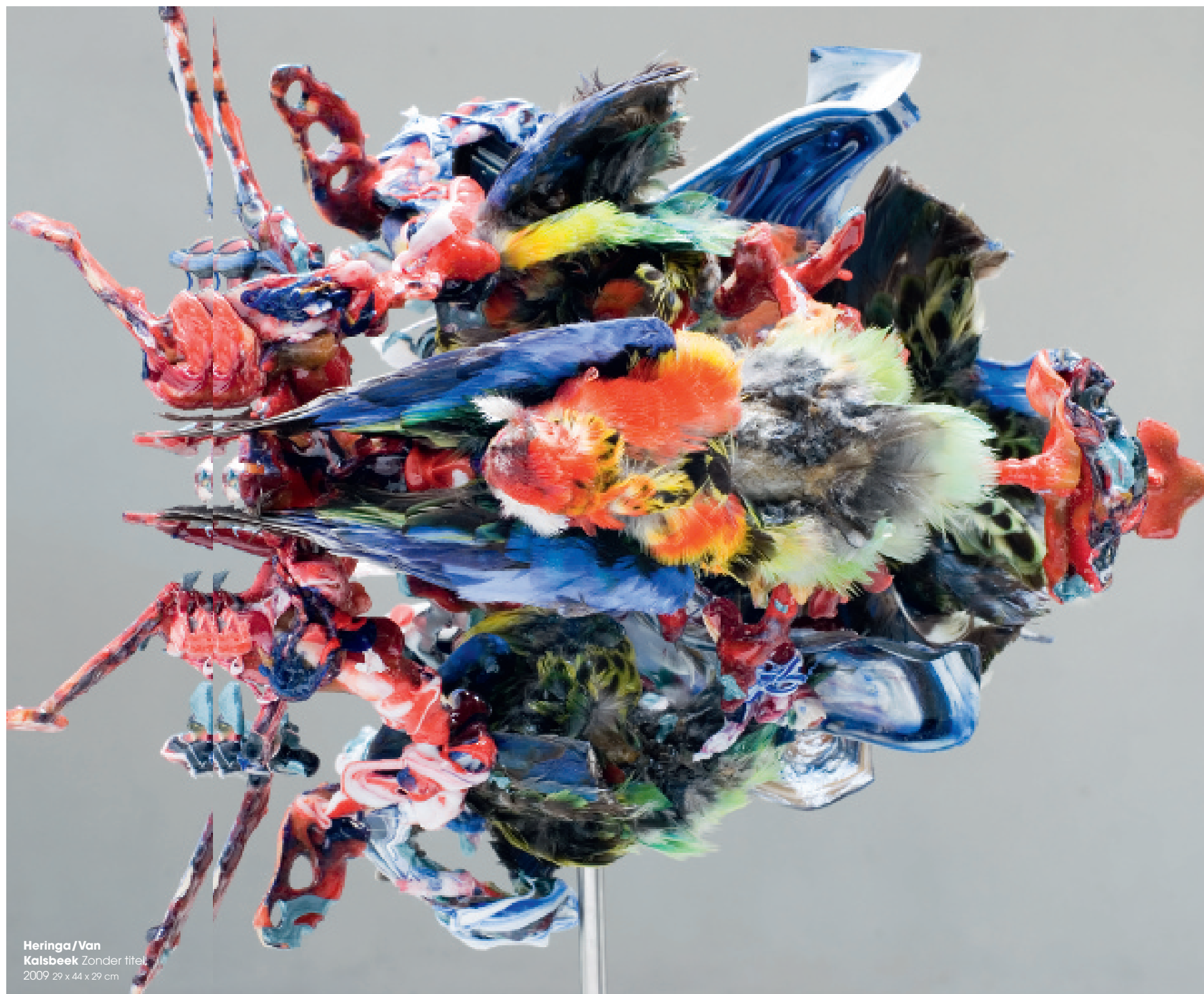
Heringa/Van Kalsbeek Zonder titel 2009 29 x 44 x 29 cm

Toeval speelt ook in de rest van het werk van Heringa/Van Kalsbeek een belangrijke rol. Tijdens de maanden in Zundert vloog een van de sculpturen in brand door een ongeluk met een lasapparaat.