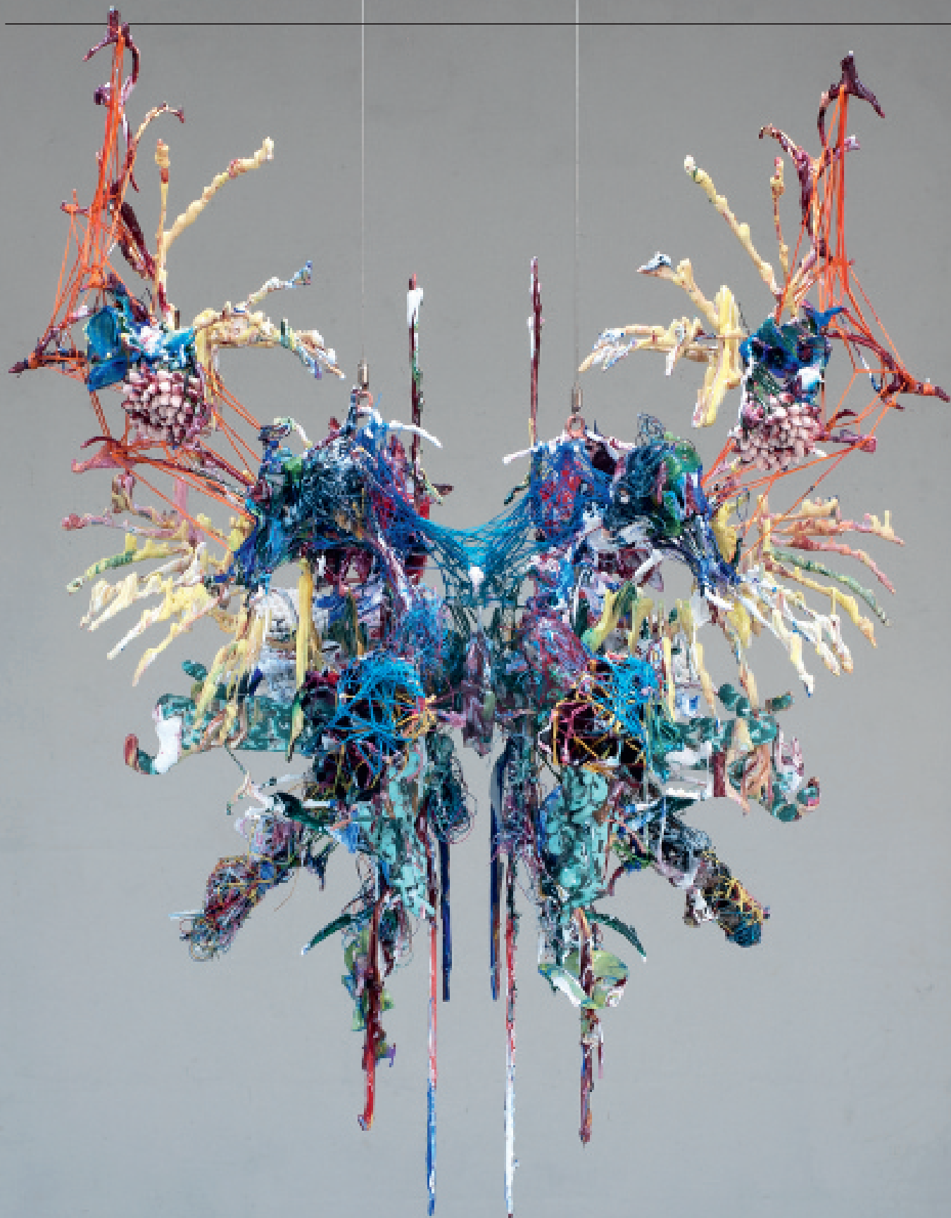
Hering/Van Kalsbeek Zonder titel, 2010 119 x 91 x 82 cm